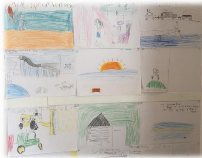
2.-4. kl. har skrevet om deres sommerferie